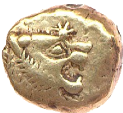
Monnaie frappée par Alyattès, roi de Lydie entre 610 et 560 av JC.

Une méthodologie, que je ferai mienne, invite à interroger l'histoire.